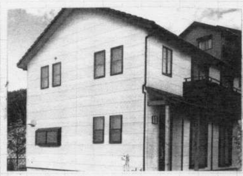
リタイルをしたあと 雰囲気もすっかり 変わりました。