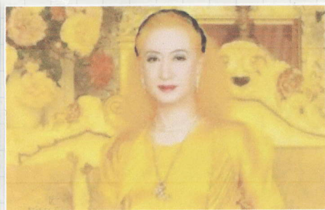
美輪さんのおうが